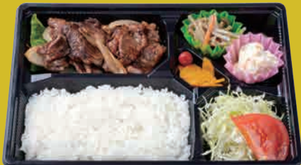
米仕上牛 カルビ焼肉弁当 ¥900