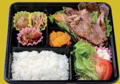
米仕上牛 2種盛りステーキ弁当 (ロース・ヘルシー) ¥2,500