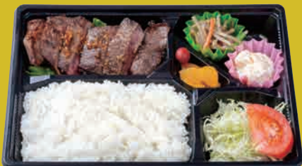
米仕上牛 ヘルシーステーキ弁当 ¥1,100