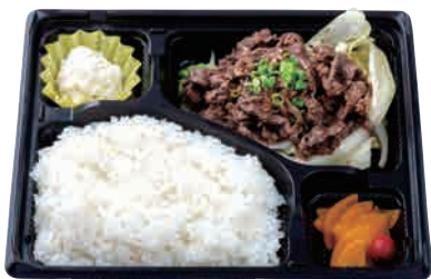
牛ロースおろし焼肉弁当 ¥750