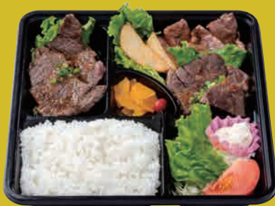
米仕上牛 3種盛りステーキ弁当 (ヒレ・ロース・ヘルシー) ¥3,500