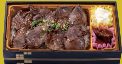
朝地ラム 塩だれ焼肉重 ¥1,000