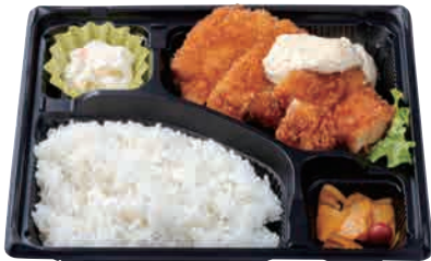
チキンバンバン弁当 ¥600