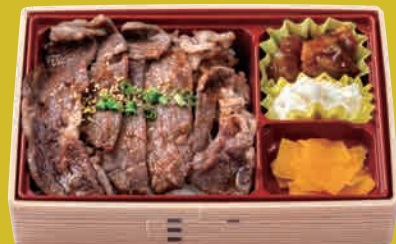
米仕上牛 リブローズ焼肉重 ¥1,300