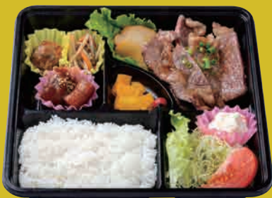
米仕上牛 ロースステーキ弁当 ¥1,800