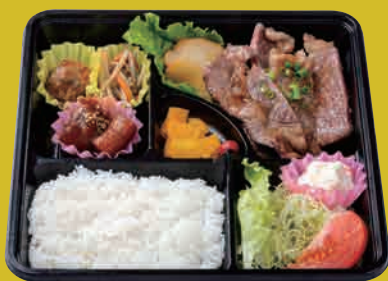
米仕上牛 ロースステーキ弁当 ¥1,800