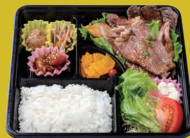
米仕上牛 2種盛りステーキ弁当 (ロース・ヘルシー) ¥2,500