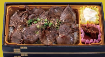
朝地ラム 塩だれ焼肉重 ¥1,000