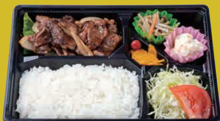
米仕上牛 カルビ焼肉弁当 ¥900