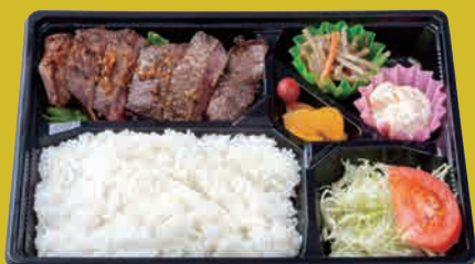
米仕上牛 ヘルシーステーキ弁当 ¥1,100