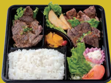
米仕上牛 3種盛りステーキ弁当 (ヒレ・ロース・ヘルシー) ¥3,500