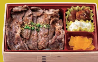
米仕上牛 リブローズ焼肉重 ¥1,300