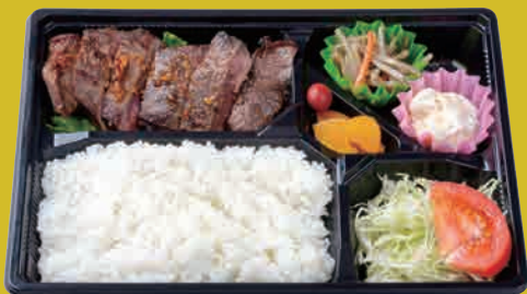
米仕上牛 ヘルシーステーキ弁当 ¥1,100