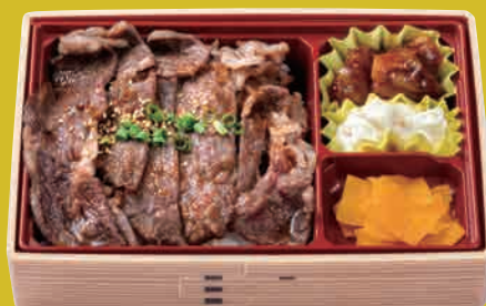
米仕上牛 リブローズ焼肉重 ¥1,300