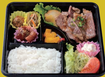
米仕上牛 コースステーキ弁当 ¥1,800