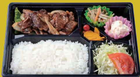
米仕上牛 カルビ焼肉弁当 ¥900